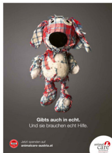
Die Plakatsujets

Mit kaputten Stofftieren weist das Team von Animal Care Austria auf das Leid von Tausenden echten Tieren hin und hofft auf die Aufmerksamkeit neuer Spender und Tierfreunde für die gute Sache. Am 4. Oktober wird diese Aktion in der einzigen europäischen Welttierschutztags-Spendengala gipfeln. Der Fundraisingabend im Grand Hotel Wien, inklusive Entertainmentprogramm und Galamenü, steht ganz im Zeichen des Tierschutzes. (as)